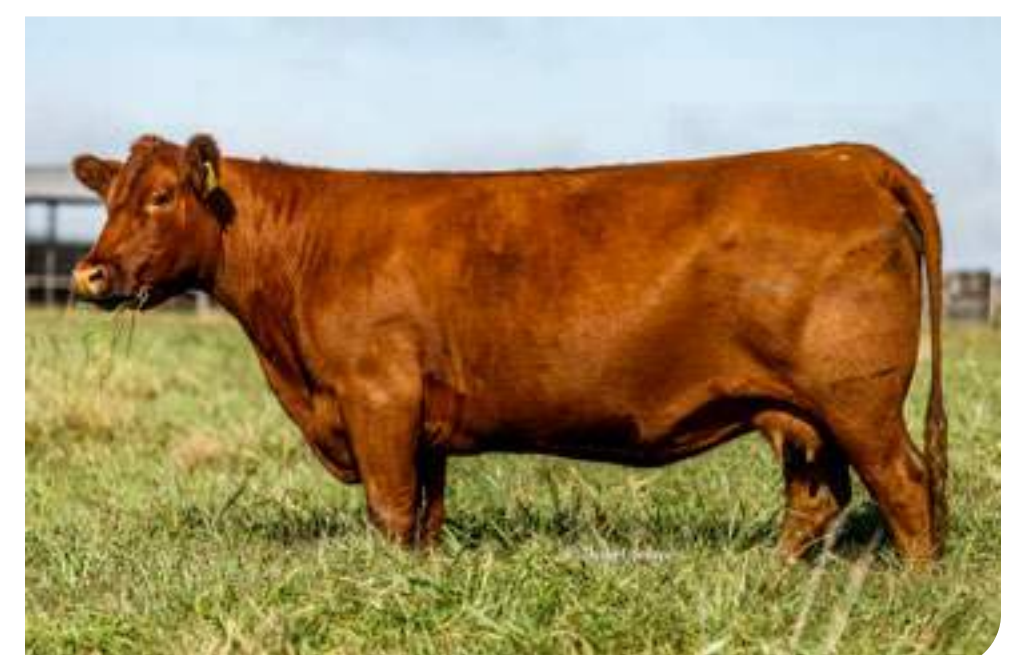
RP 4415 Remosada , su ab. materna.