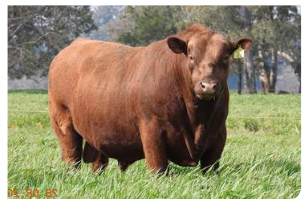
Galáctico , su padre.